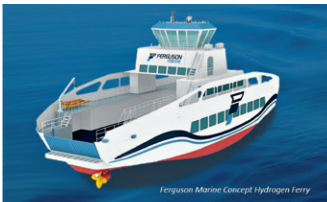
Abb. 1: HySeas-III-Zeichnung

Pa-X-ell 2 hat weiterhin die Bordenergieversorgung von Kreuzfahrtschiffen im Visier. Ziel ist, mehrere methanolbetriebene BZ-Einheiten dezentral in ein Passagierschiff einzubauen, so dass die Feuerzonen unabhängig voneinander – auch im Hafen – mit sauberem Strom und auch mit Wärme versorgt werden können (s. Abb. 2).