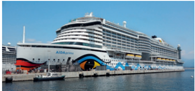
Abb. 2: Die AIDAprima landete auf Rang 3 des NABU-Rankings

tikel und kein Geruch“. Die Wes Amelie ist ein Containerschiff, das mit MKS-Fördermitteln zu 60 Prozent gefördert und innerhalb von 90 Tagen auf LNG umgerüstet wurde. Laut Hoepfner wird dadurch rund 31 Prozent weniger CO 2 emittiert. Selbst unter Berücksichtigung des Methanschlupfes (Austritt unverbrannten Methans), der derzeit bei etwa 25 Prozent liegt, sei insgesamt immer noch eine Verringerung der treibhausgaswirksamen Emissionen sichergestellt. Zudem sei kraftstoffseitig mit verflüssigtem Erdgas eine Kostenreduktion in Höhe von „mindestens 25 Prozent“ realisierbar.